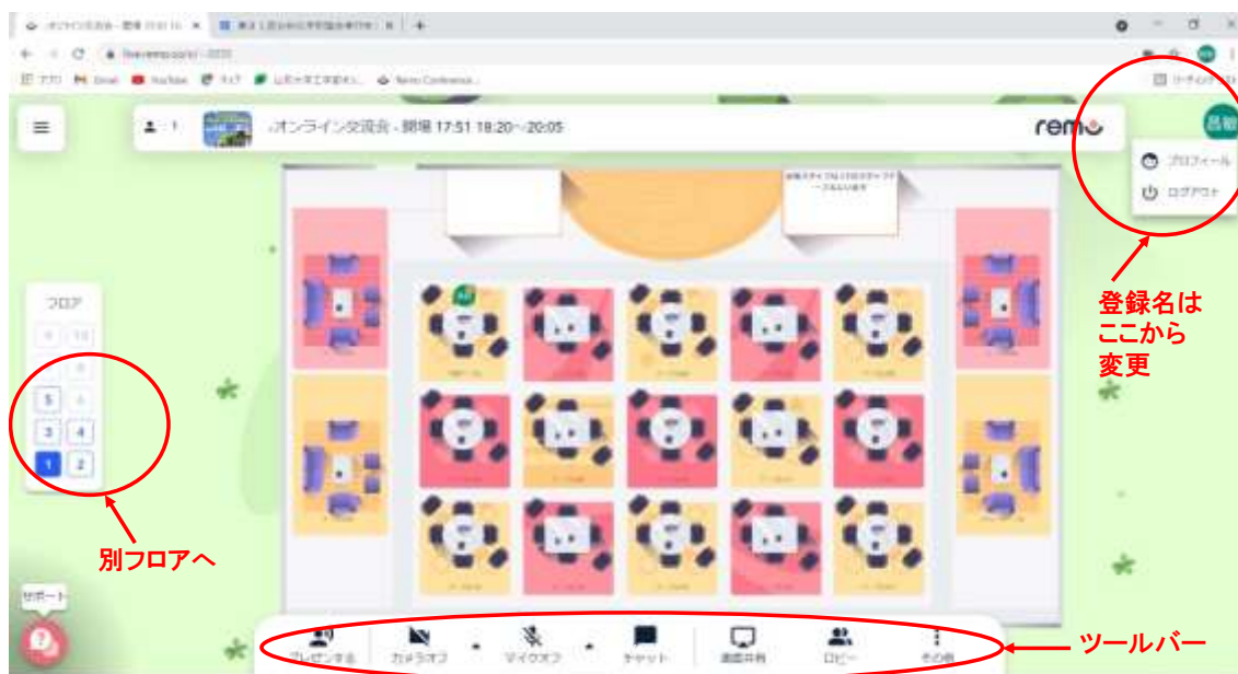
図2 フロア（交流会会場のレイアウト）

なお、 google アカウントでログインした場合、登録名が上記の形式ではなくなります。ログイン後に変更をお願いします。（図2：右上のアイコン→ マイプロフィール）。